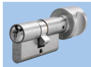
Wkładka z gałką