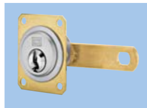
Wkładka z rygłem